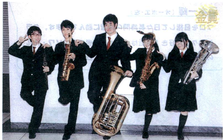
第44回 兵庫県アンサンブルコンテスト 西阪神地区大会 2016年12月27日 みつなかホール

あけましておめでとう 今年も頑張ります 来年はもっと頑張ります 応援よろしくお願いします